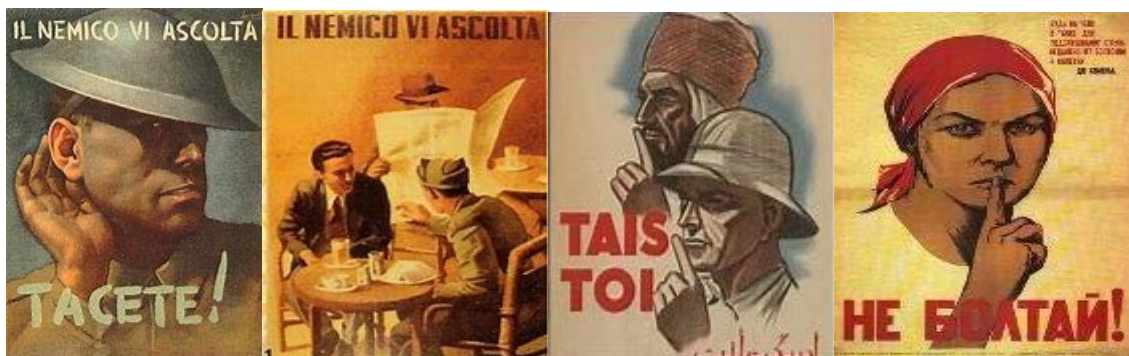
Figura 1. Taci! Il nemico ti ascolta

La guerra ha il potere di spostare la minaccia: essa non si cela più all'interno della popolazione che si vuol controllare nella sua fedeltà al regime, ma è identificata col nemico esterno, visibile, definito e contro il quale si può militarizzare il proprio popolo, per ingaggiarlo in un conflitto mortale, decisivo, "supremo".