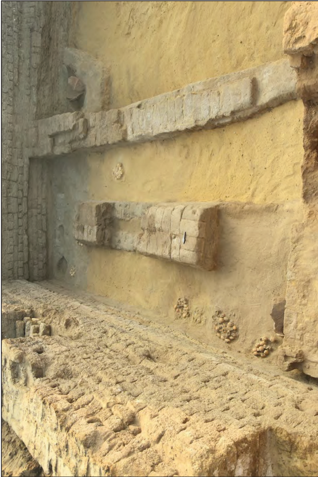
Fig. 10. – Ambiente est dell'incubatoio visto da ovest (III sec. a.C.) (Sayed Awad Mohamed).