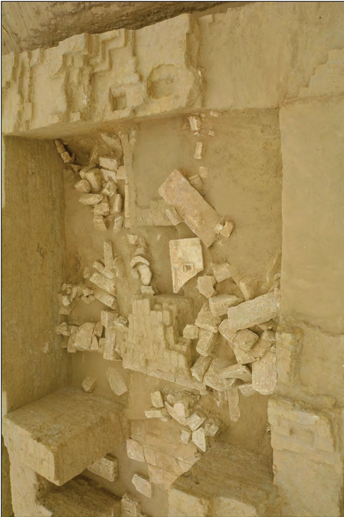
Fig. 5. – Il naos smantellato del tempio C3400-II (Sayed Awad Mohamed).