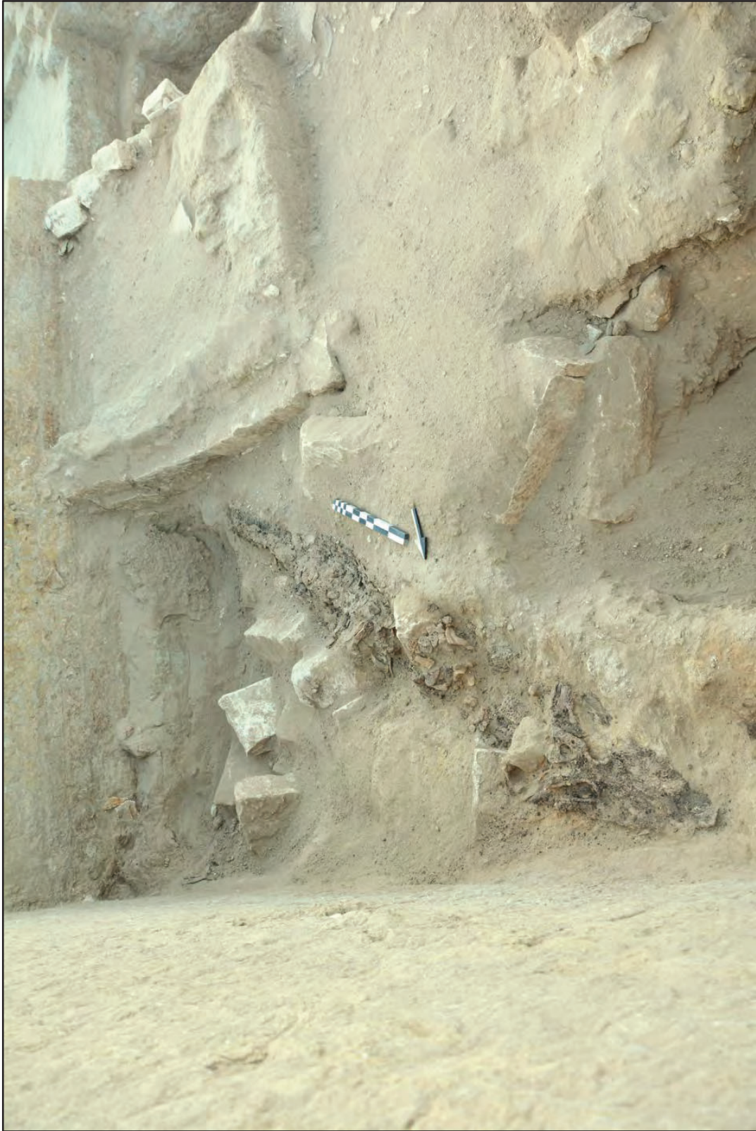
Fig. 6. – Mummia di cocodrillo rimossa dall'altare del tempio C3400-II (Sayed Awad Mohamed).