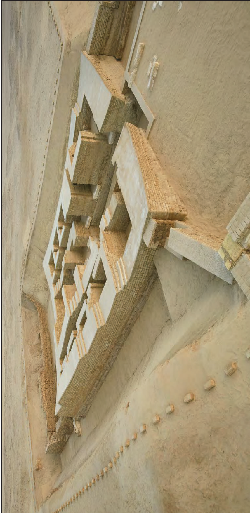
Fig. 3. – Il tempio C3400-II consolidato visto da nord-ovest (II-I sec. a.C.) (Matjaž Kačičnik).