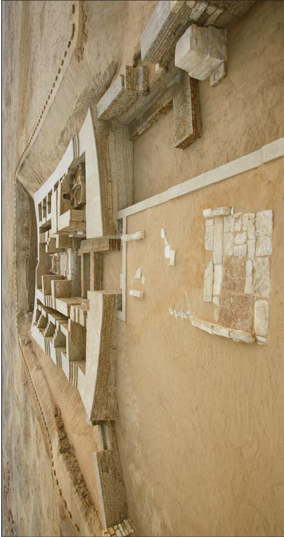
Fig. 1. – Il tempio C3400-II visto da ovest (II-I sec. a.C.) (Ihab Mohamed Ibrahim).