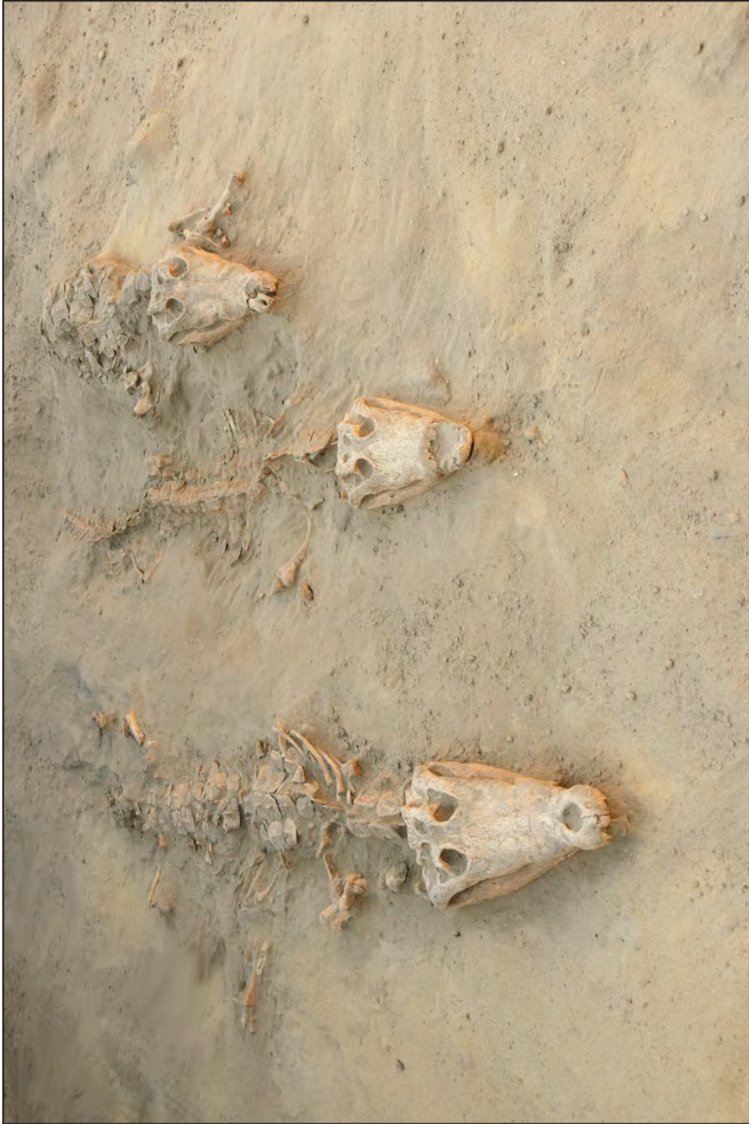
Fig. 9. – Coccodrilli sepolti nel recinto (III-II sec. a.C.) (Gisèle Hadji-Minaglou).