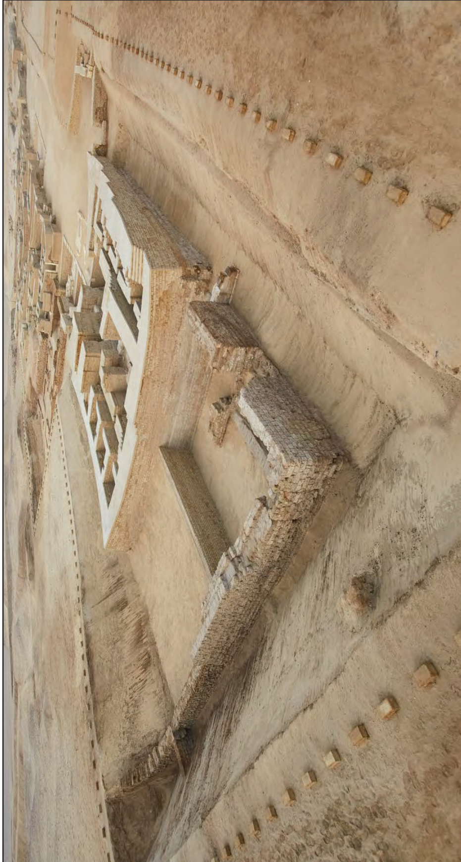
Fig. 8. – Il recinto visto da nord-est (III sec. a.C. – III sec. d.C.) (Matjaž Kačičnik).