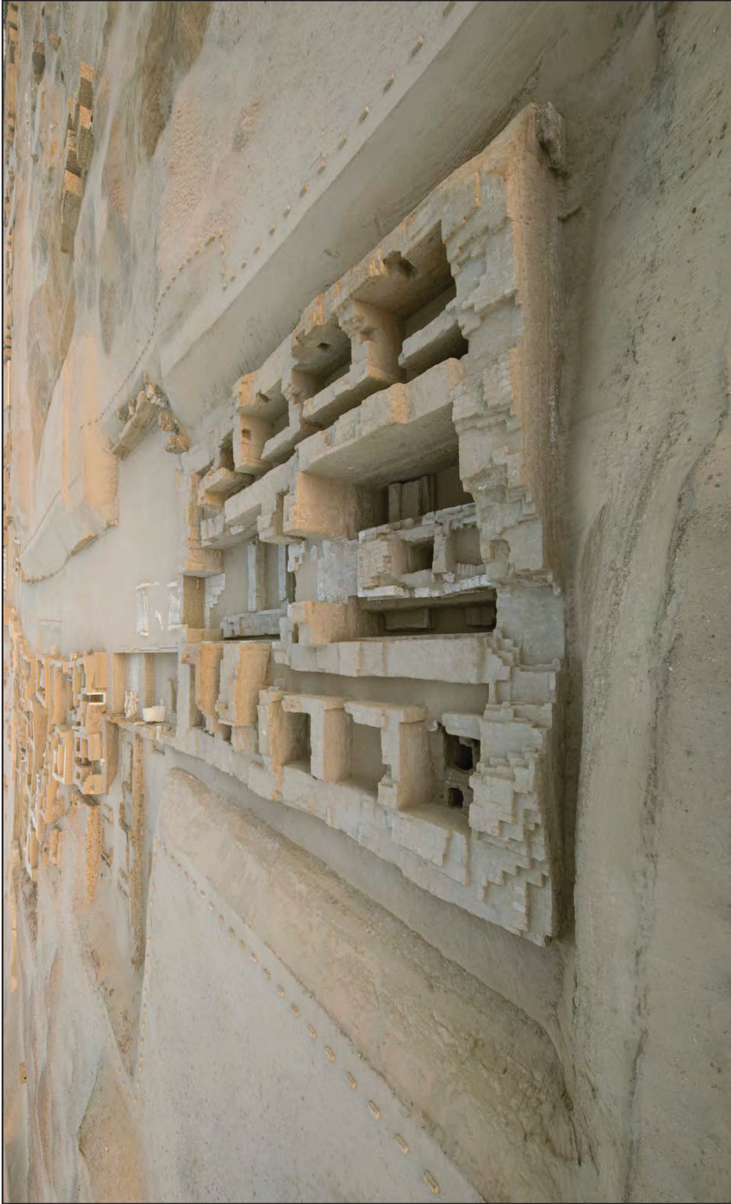
Fig. 2. – Il tempio C3400-II e il “dromos di Tefresudj(ty?)” visti da est (Ihab Mohamed Ibrahim).