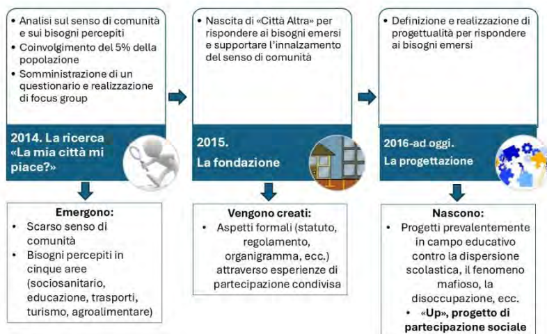
Fig. 1 – Città Altra: oltre dieci anni di vita tra ricerca e intervento.

La vita di questa Cooperativa di Comunità è stata sino a oggi definita attraverso processi di ricerca azione (Greenwood e Levin, 2007) che hanno consentito di definire e ridefinire ricorsivamente gli interventi di Città Altra. In questo scenario, il lavoro della gruppoanalista si è integrato con quello di altri professionisti all'interno di un team multidisciplinare composto anche da psicologi sociali e dell'organizzazione, esperti in campo educativo e di animazione sociale, statistici, pedagogisti ecc. In generale, si è sviluppato nel