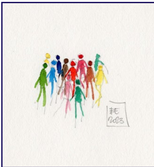
People are strange when you're stranger. Illustrazione realizzata da Eliano Biagioni

suto associativo, tassello che si costruisce attraverso la parola scritta e la lettura, attività che riveste un'importanza centrale nella mia vita e, credo, in quella di molti formatori.