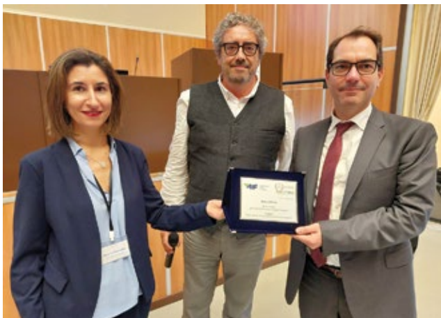
La consegna del Premio alla Banca d'Italia